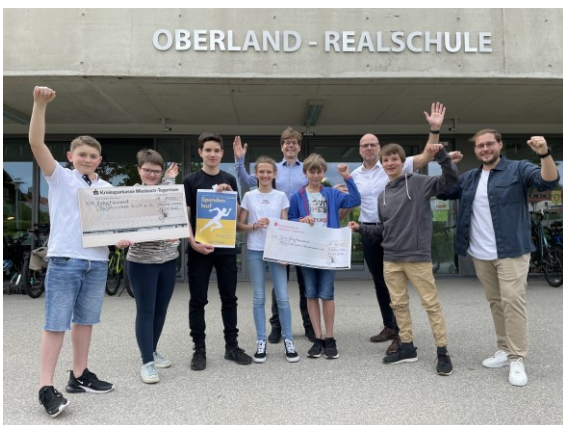
OBERLAND - REALSCHULE