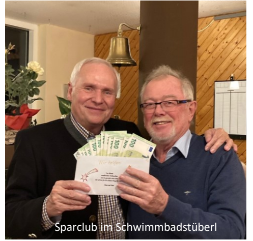
Sparclub im Schwimmbadstüberl