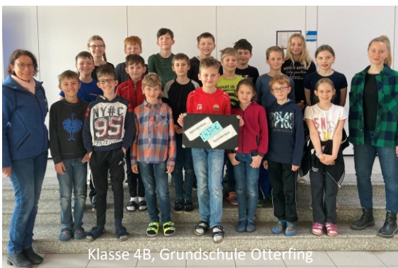
Klasse 4B, Grundschule Otterfing