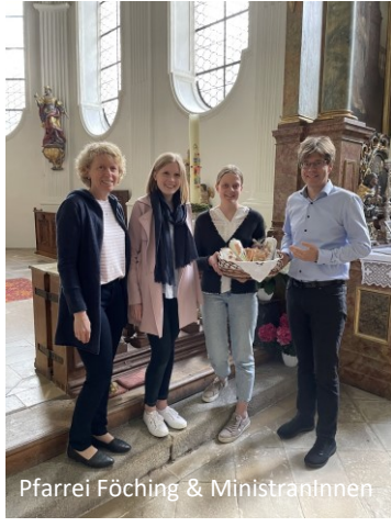
Pfarrei Föching & Ministrantinnen