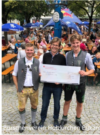
Bürschverein Holzkirchen Erikam