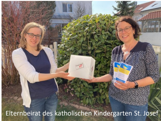
Elternbeirat des katholischen Kindergarten St. Josef