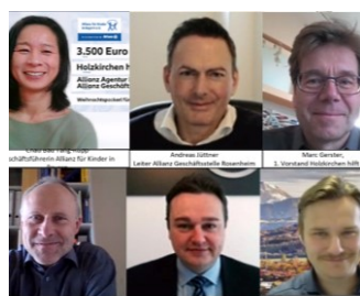
Allianz für Kinder in Bayern e.V.