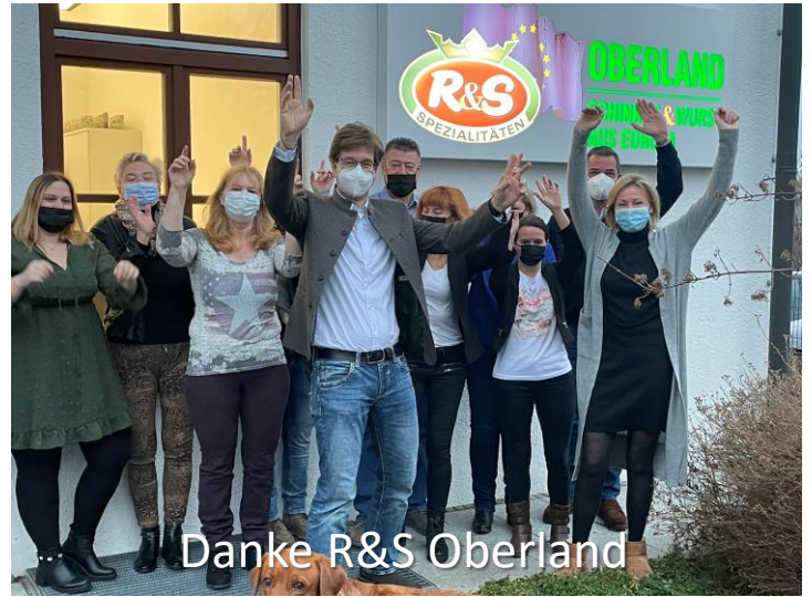
Danke R&S Oberland