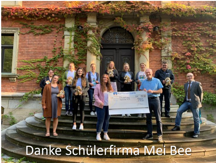
Danke Schülerfirma Mei Bee