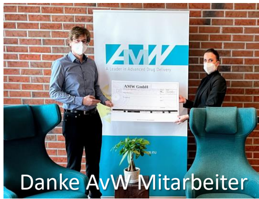
Danke AvW Mitarbeiter