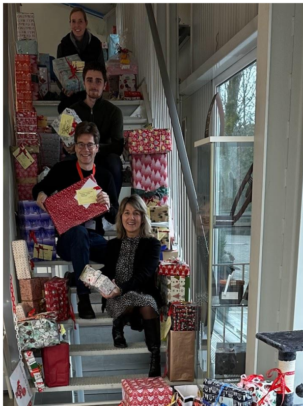
Kurz vor Weihnachten werden die Geschenke verteilt.