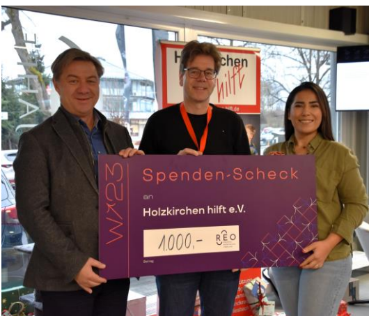
Regionalentwicklung Oberland REO