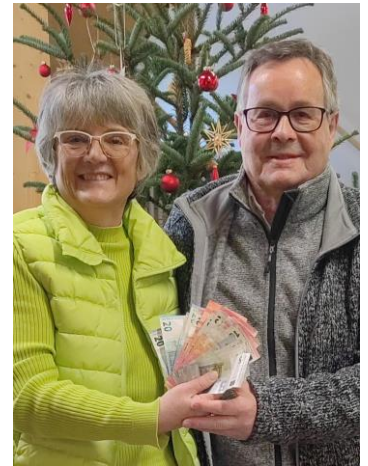
Grünes Zentrum Holzkirchen